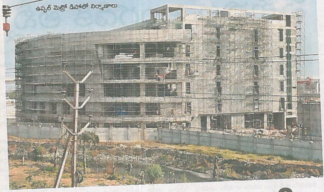
ఉప్పల్ మెట్రో డిపోలో నిర్మాణాలు

హైదరాబాద్ మెట్రో రైలు ప్రాజెక్టులో కీలకంగా మారిన ఉప్పల్ డిపో పనులు దాదాపు పూర్తికావచ్చాయి. ఇప్పటికే 85 శాతం పనులు పూర్తయ్యాయి. మిగిలిన 15 శాతం పనులను ఈ నెలాఖరులోగా పూర్తి చేయాలన్న కృతనిశ్చయంతో ఇంజనీర్లు, అధికారులు పని చేస్తున్నారు. డిపోలో ట్రాక్ నిర్మాణంతో పాటు, ప్లాట్‌ఫాంలు, విద్యుత్ లైన్లు, సిగ్నలింగ్ వ్యవస్థలను ఇప్పటికే ఏర్పాటు చేశారు. నాగోలు వద్ద గల మొదటి పిల్లర్ నుంచి మొదలుకొన్న కారిడార్ కు లొకేజీ పనులు సైతం చురుగ్గా సాగుతున్నాయి. డిపో నిర్మాణ పనులను వీలైనంత త్వరగా పూర్తి చేయడానికి సుమారు 1200 మంది కార్మికులు, సాంకేతిక నిపుణులు రాత్రింబవళ్లు కష్టపడుతున్నారు. ఈ మార్గంలోని సర్వే ఆఫ్ ఐండియా స్టేషన్ నుంచి హాబ్స్ గూడ స్టేషన్ వరకు నాలుగు కిలోమీటర్ల మేర ట్రాక్ నిర్మాణ పనులు పూర్తయ్యాయి. ట్రాక్ నిర్మాణంతో పాటే హాబ్స్ గూడ, ఎన్జీఆర్ఐ, సర్వే ఆఫ్ ఐండియా, ఉప్పల్ స్టేషన్లు 50 శాతం నిర్మాణ పనులు పూర్తయ్యాయి. ట్రాక్ నిర్మాణం ముగించిన వెంటనే విద్యుత్ లైన్ల ఏర్పాటు పనులను కొనసాగిస్తున్నారు. ఇప్పటికే ఆదే రూట్లో విద్యుత్ స్తంభాలను సైతం ఏర్పాటు చేస్తున్నారు. ఈ డిపో కేంద్రంగానే కారిడార్ 3లోని మెట్రో రైళ్ల నిర్వహణ, రైల్ స్టేషన్లు, ఇంజనీరింగ్, వాహనాల నిర్వహణను చేపడతారు. వర్కషాపు కూడా ఇక్కడే