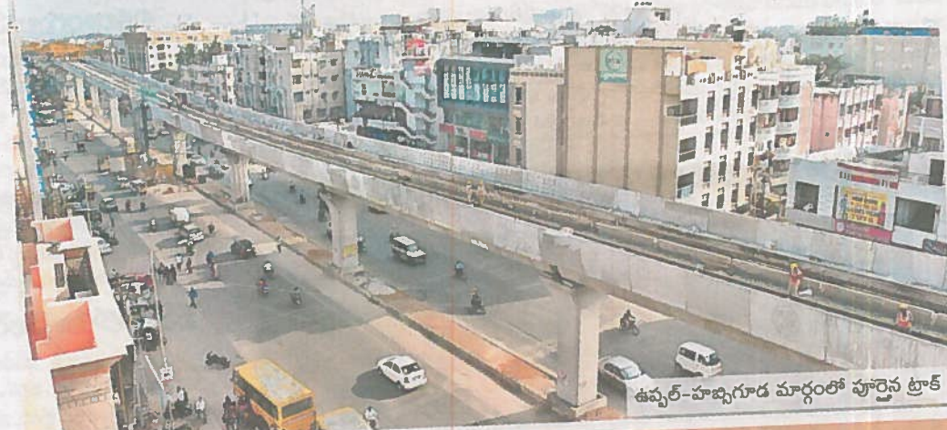
ఉప్పల్-హబ్స్ గూడ మార్గంలో పూర్తైన ట్రాక్