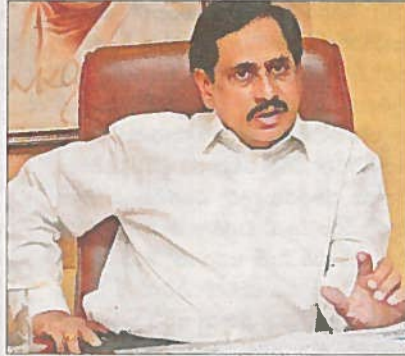
పలువురు సిటీజనులు వివిధ అంశాలపై ఎండ్స్ ఫోన్ లో ప్రశ్నించి వివరాలు తెలుసుకున్నారు.