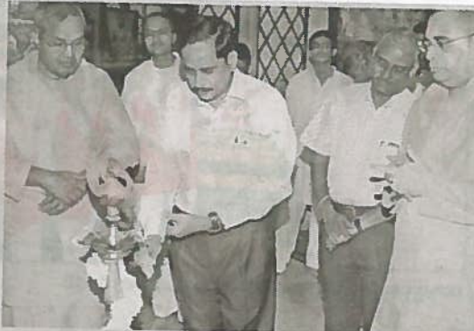
జ్యోతి ప్రజ్వలన చేసి కార్యక్రమాన్ని ప్రారంభిస్తున్న ఎన్టీఆర్ రెడ్డి

దేశంలోని మిగతా నగరాలతో పోల్చుకుంటే హైదరాబాద్ లో మెట్రో రైలు ప్రాజెక్టును మెరుగ్గా చేపడుతున్నామని తెలిపారు. ఇందుకుగాను అత్యాధునిక సాంకేతిక పరిజ్ఞానాన్ని వినియోగిస్తున్నామని వివరించారు. ముంబయిలో నిర్మించిన 11 కిలోమీటర్ల మెట్రో రైలు పనులకు ఏడేళ్లు పట్టిందన్నారు. కానీ హైదరాబాద్ లో మూడేళ్లలోనే 50 మిగతా 4లో..