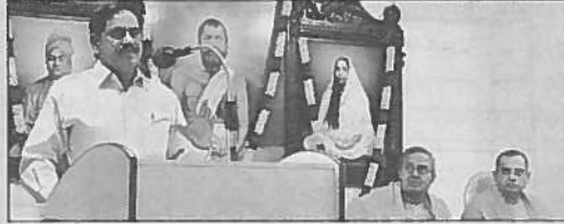
కార్యక్రమంలో మాట్లాడుతున్న ఎన్టీఆర్