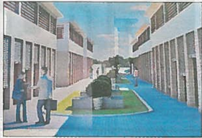
భరత్ నగర్లో ఏర్పాటు చేయనున్న సైబెక్ రైతుబజార్ నమూనాలు

మూడు మార్కెట్లలో సుమారుగా 150 మంది రైతులు, వ్యాపారులు, అమ్మకందారులు ఉంటారు. ఏసీ డార్కెటరీ రూం.. రైతులు వ్యాపారులు విశ్రాంతి తీసుకోవడానికి వీలుగా ఇక్కడే ఏసీ డార్కెటరీ రూంను ఏర్పాటు చేయబోతున్నారు. ఇక్కడ 40 మంది రైతులు విశ్రాంతి తీసుకోవడానికి వీలుగా గదిని నిర్మిస్తున్నారు. అర్ధరాత్రి వరకు మార్కెట్లోనే గడపాల్ని రావడంతో వారి సౌకర్యార్థం ఇదే గదిలో, సమాశ్రయాలను, మరుగుదొడ్లు ఏర్పాటు చేస్తారు. ఈ తరహా ఏర్పాట్లు గ్రేటర్లోని రైతు బజార్లలో ఎక్కడ కనిపించకపోవడం గమనార్హం. ఫుడ్ జోన్.. స్టేషన్లో ప్రత్యేకంగా ఫుడ్ జోన్ ను సైతం ఏర్పాటు చేయబోతున్నారు. ఇక్కడ తిన బండారాలు, స్నాక్స్, కూల్ డ్రింక్స్ కోసం కియోస్క్లను ఏర్పాటు చేస్తారు. పార్కులో తచ్చాడినట్లుగా ఇక్కడ ఫుడ్ జోన్ ఆకర్షణయంగా తీర్చిదిద్దుతున్నారు. నిర్మాణానికే బానట్లుగా.. ప్రస్తుతం భరత్ నగర్ స్టేషన్ నిర్మించనున్న ప్రాంతంలో