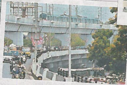
తార్నాక ఫ్లైవోవర్ దగ్గర...

మెట్రో రైలు సన్నాహక పనులు పెడుతోంది. అధికారులు ఉప్పల్ నుంచి మెట్టుగూడ వరకూ రైలును బుధవారం వేగంపెంచి పరీక్షించారు. ఆ మార్గంలో రాకపోకలు సాగించిన నగరవాసులు ఈ దృశ్యాల్ని ఆసక్తిగా తిలకించారు.