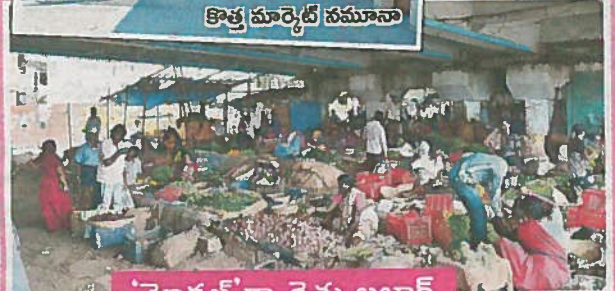
'మోడల్'గా రైతు బజార్

భరత్‌నగర్‌లో పై ఓవర్ పక్కనే ఏళ్ల తరబడిగా కూరగాయల మార్కెట్ కొనసాగుతోంది. మెట్రో స్టేషన్ నిర్మాణం కోసం అక్కడ ఉన్న రైతుబజార్ స్థలాన్ని హెచ్ఎంఆర్ సేకరించింది. కొత్తగా అక్కడ అధునాతనంగా మోడల్ రైతుబజార్‌ను నిర్మించేందుకు ఏర్పాట్లు చేసింది. స్థల సేకరణతో వ్యాపారులకు ఇబ్బంది కలగకుండా పైఓవర్ కింద గోడౌన్లకు హెచ్ఎంఆర్ అద్దె చెల్లిస్తూ అక్కడ తాత్కాలిక మార్కెట్‌ను సర్దుబాటు చేసింది. కొత్తగా అక్కడ దుకాణ సముదాయాల నిర్మించాక వీరిని అక్కడికి తరలించనున్నారు.