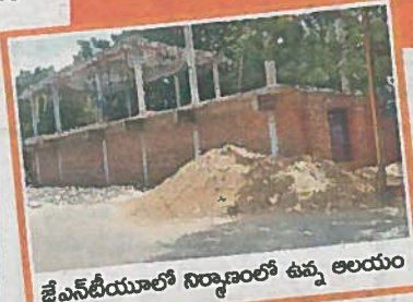
జేఎన్టీయూలో నిర్మాణంలో ఉన్న ఆలయం