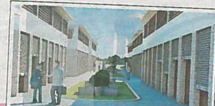
కొత్త మార్కెట్ సమూహం

సేకరించిన స్థలాల స్థానంలో ఆయా ప్రభుత్వ సంస్థల అభ్యర్థనల మేరకు అధునాతన కార్యాలయాలను హెచ్ఎంఆర్ నిర్మించి ఇస్తోంది. ఇప్పటికే కొన్నింటిని పూర్తిచేసింది. నాంపల్లిలో తహసీల్దార్ కార్యాలయం భవనాన్ని నిర్మించింది. యాత్రీనివాస ప్రాంతంలో ఆర్డీవో, తహసీల్దార్ కార్యాలయ భవనం నిర్మాణంలో ఉంది. రహదారిపక్కాలో పోలీసు బ్యారెక్స్, పాతగాండ్ ఆసుపత్రి సమీపంలో విశాంతి గదులను నిర్మించనుంది.