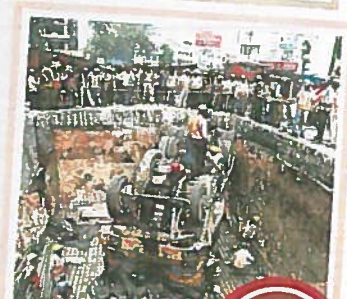
7వ దశ కొరం-2

కొరం-2లోని మార్గమిది. పాతబస్తీని కొత్త నగరానికి అనుసంధానం చేసే అత్యంత కీలకమైన ప్రాజెక్ట్ ఇది. ఒకే దశలో పూర్తిచేయాలనేది లక్ష్యం. 15.19 కిలోమీటర్ల దూరం ఉంది. 588 ప్రయాణి వేయాల్సి ఉంది. కేవలం 19 ప్రయాణి మాత్రమే ఇప్పటివరకు నిర్మాణమయ్యాయి. ఈ మార్గంలో లోపల విస్తరణ పనులు దాదాపు పూర్తిచేయబడ్డాయి. మెట్లో పనులు ఉపయోగపడుతున్నాయి.