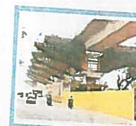
2వ దశ కొరం-1

కొరం-1లో ఈ మార్గం వస్తుంది. 306 ప్రయాణి రానున్నాయి. వీటిలో ఇప్పటివరకు 108 మాత్రమే పూర్తయ్యాయి. ఈ మార్గంలో ఆరు స్టేషన్లు రానున్నాయి. కేవలం రెండు స్టేషన్లు ప్రయాణి మాత్రమే పైకిలే వాయి. దూర సేవలకు వివాదాల నడుమ ఈ మార్గంలో పనులు కత్త నడకన సాగుతున్నాయి ఇప్పటికే డింపుల్, డైరెక్ట్ లైన్ స్టేషన్, కంప్లెక్స్ వద్ద వివాదాలు ఉన్నాయి డైరెక్ట్ మిసమ్ మిగతా దూర యజమానం దాపాప దీంతో ఇప్పటి వరకు కొంత ఇబ్బందికర పరిస్థితులు ఎదురవుతున్నాయి.