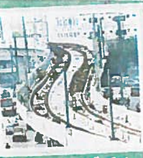
1వ దశ నాగోల్ - మెట్టుగూడ

కొరం-1లోని మూడు ప్రధాన మార్గాల్లో మెట్లో రైలును ప్రతిపాదించారు. దశల వారీగా వీటిని పూర్తి చేసేందుకు నిర్మాణ సంస్థ పనులు చేపట్టింది. మియాపూర్ నుంచి ఎల్. బీ.నగర్ వరకు మొదటి రైలువార్ కాగా, తేటోన నుంచి కలకత్తా వరకు రెండో కారిడార్, నాగోల్ నుంచి శిల్పాకామం వరకు మూడో కారిడార్ గా పరిగణిస్తున్నారు.