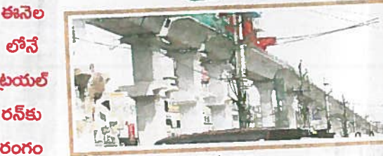
5వ దశ ఎస్.ఆర్.నగర్ నుంచి ఎల్.బీ.నగర్

అయితే రన్ కు సిద్ధమైన మెట్టుగూడ.. నాగోల్ మార్గంలో కిలోమీటర్లకు ఒక స్టేషన్ ఉంది. రెండు స్టేషన్ల మధ్య తక్కువ దూరం 0.86 కి.మీ. కాగా ఎక్కువ దూరం 1.60 కిలో మీటర్లు ఉంది.